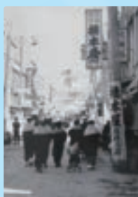
福岡市平和台(昭和10年)