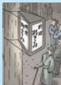
三角形三面ガラス入り行灯型広告 (明治時代)