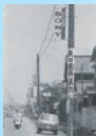
茨城県笠間市(昭和30年代)