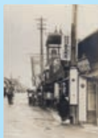
埼玉県熊谷市中山道(昭和6年)