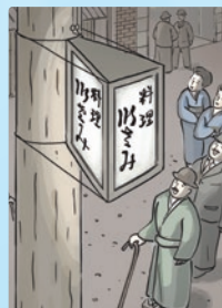
三角形三面ガラス入り行灯型広告 (明治時代)