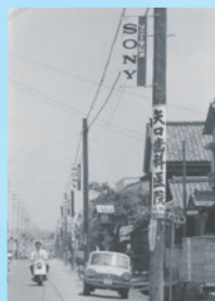
茨城県笠間市(昭和30年代)