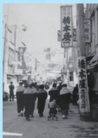
福岡市平和台(昭和10年)