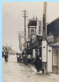
埼玉県熊谷市中山道(昭和6年)